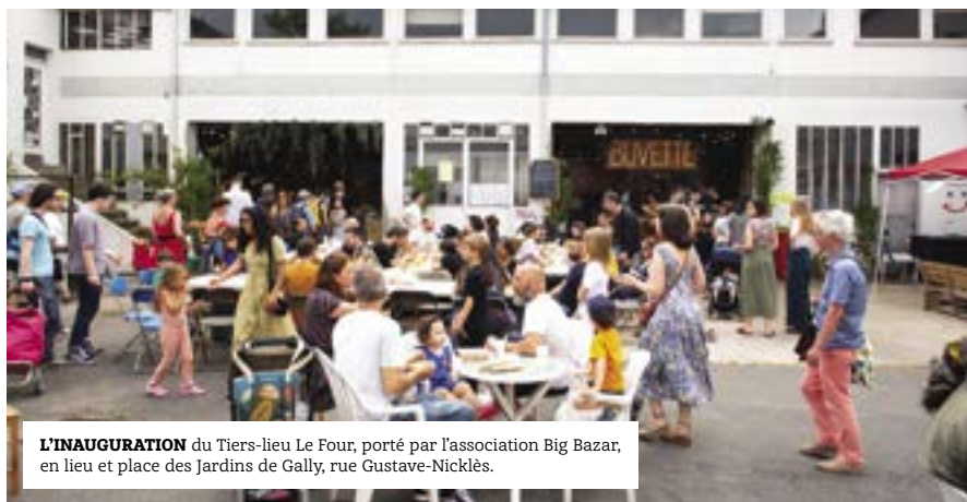
L'INAUGURATION du Tiers-lieu Le Four, porté par l'association Big Bazar, en lieu et place des Jardins de Gally, rue Gustave-Nicklès.