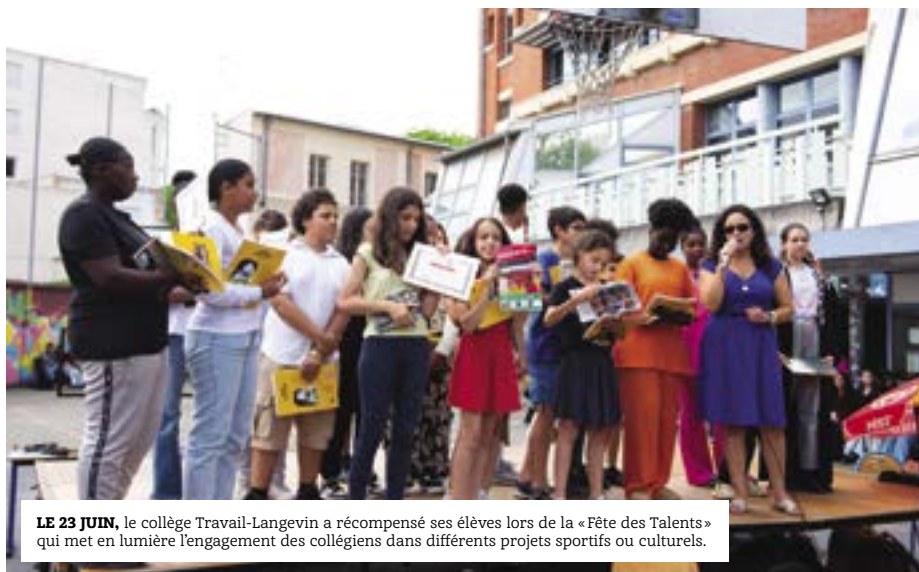
LE 23 JUIN , le collège Travail-Langevin a récompensé ses élèves lors de la «Fête des Talents» qui met en lumière l'engagement des collégiens dans différents projets sportifs ou culturels.