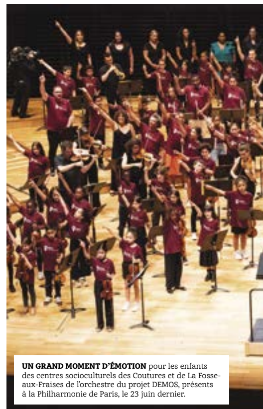
UN GRAND MOMENT D'ÉMOTION pour les enfants des centres socioculturels des Coutures et de La Fosse-aux-Fraises de l'orchestre du projet DEMOS, présents à la Philharmonie de Paris, le 23 juin dernier.