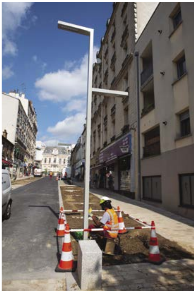
Installation de nouveaux luminaires LED, rue Raoul-Berton.