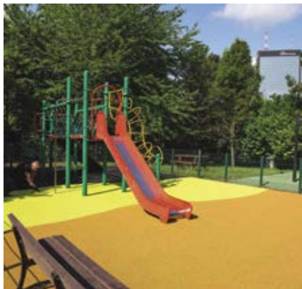
Nouvel enrobé sur l'aire de jeux au square Schnarbach.