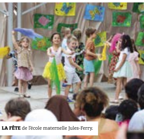
LA FÊTE de l'école maternelle Jules-Ferry.