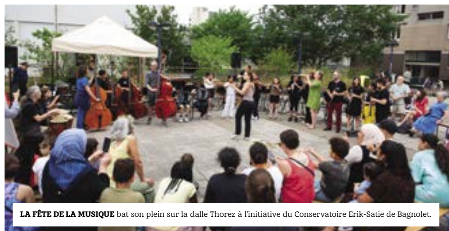
LA FÊTE DE LA MUSIQUE bat son plein sur la dalle Thorez à l'initiative du Conservatoire Erik-Satie de Bagnolet.