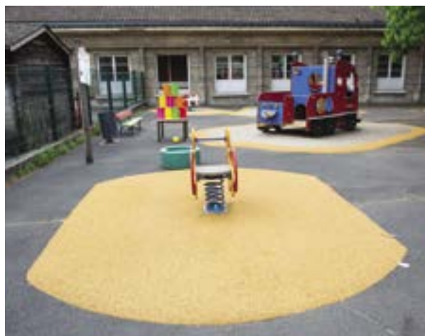
Les jeux de l'école maternelle Henri-Barbusse ont également de nouveaux enrobés.