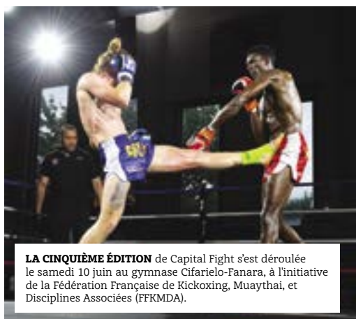
LA CINQUIÈME ÉDITION de Capital Fight s'est déroulée le samedi 10 juin au gymnase Cifarielo-Fanara, à l'initiative de la Fédération Française de Kickboxing, Muaythai, et Disciplines Associées (FFKMDA).