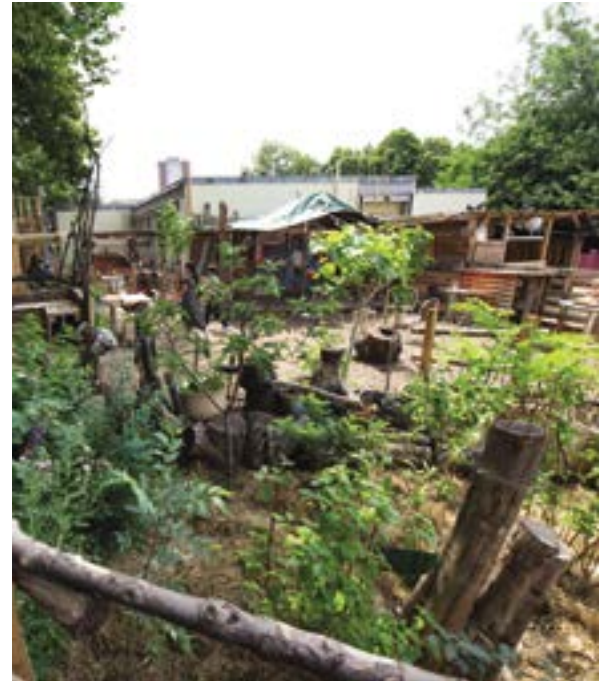
Le nouveau terrain de La Bergerie au 3, rue Auguste-Blanqui dans le quartier Les Malassis.