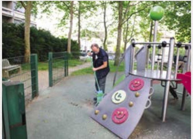
Les services Espaces verts et Propreté à pied d'œuvre pour entretenir les lieux.