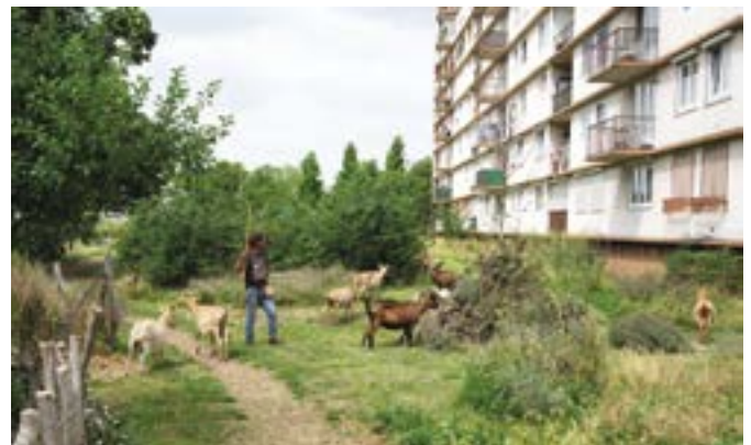
Les chèvres de La Bergerie broutent aux «Prés Jumeaux», rue Raymond-Lefebvre, dans le quartier Les Malassis.

La prochaine étape de l'association est de créer de l'emploi en recrutant un apprenti l'année prochaine en attendant la fin des travaux de l'école Pêche-d'Or et l'extension programmée de l'espace réservée à La Bergerie.