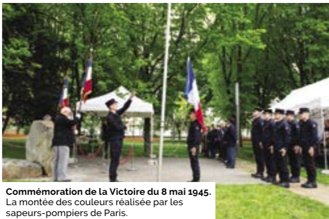
Commémoration de la Victoire du 8 mai 1945. La montée des couleurs réalisée par les sapeurs-pompiers de Paris.