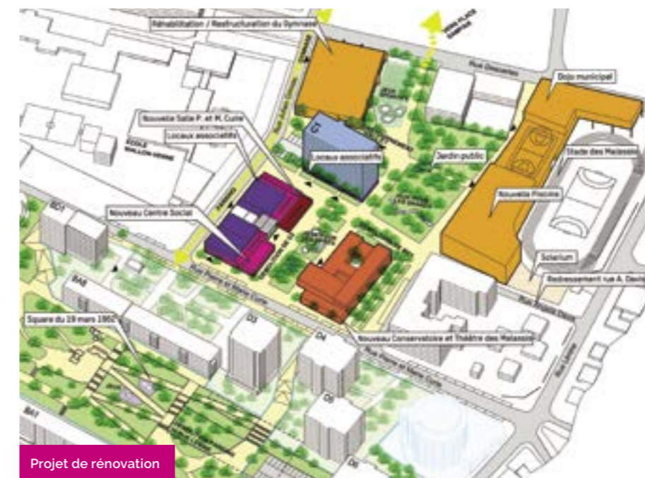
Projet de rénovation

La programmation élargie comprend ainsi la reconduction des installations sportives du stade sous la forme suivante :