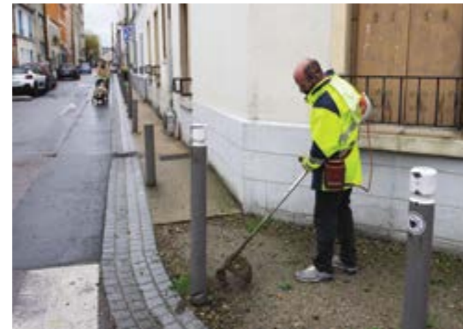
Rotoflage des herbes en bas d'immeubles, rue Victor-Hugo.