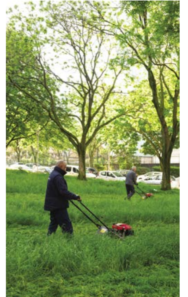
La Capsulerie, tonte nécessaire après les fortes pluies.