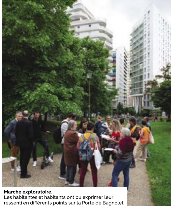
Marche exploratoire. Les habitantes et habitants ont pu exprimer leur ressenti en différents points sur la Porte de Bagnolet.