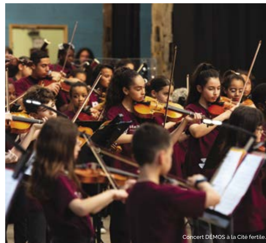
Concert DÉMOS à la Cité fertile.

ment des classes CHAM, de nombreuses actions d'accompagnement artistique sont menées par les établissements scolaires avec le soutien des collectivités territoriales et de l'État: projet DÉMOS, projet orchestre à l'école, etc.