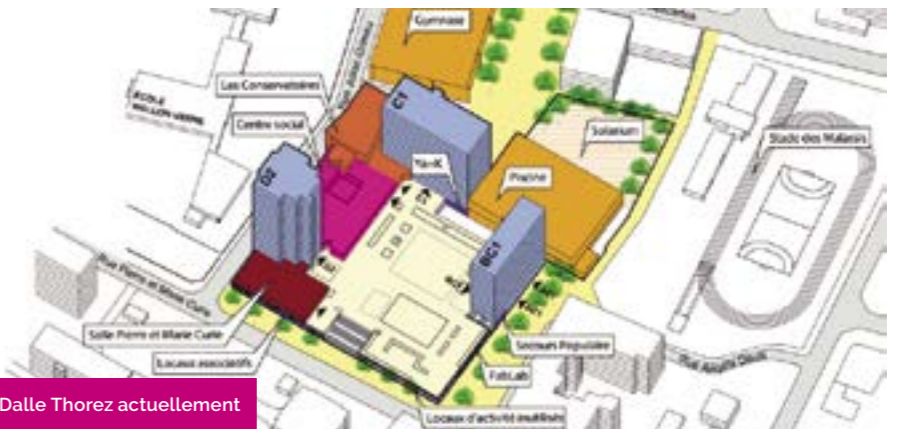
Dalle Thorez actuellement

Le coût total de l'équipement est de 22,29 millions d'euros TTC pour les travaux, auxquels s'ajoutent 3,45 millions d'euros TTC d'études, dont environ 1/3 pour la partie terrain et dojo. C'est pourquoi la Ville de Bagnolet a souhaité s'associer au projet d'Est Ensemble pour réaliser un programme commun sur la parcelle du stade des Malassis. Du fait de la vétusté du terrain synthétique de football et de la piste d'athlétisme et pour répondre aux contraintes environnementales d'aménagement imposées dans les documents d'urbanisme, un réaménagement global de la parcelle est prévu.