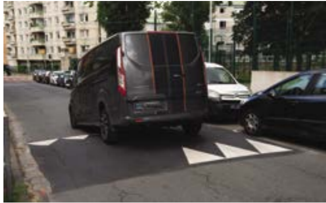
Création de deux nouveaux ralentisseurs, rue du Lieutenant-Thomas.