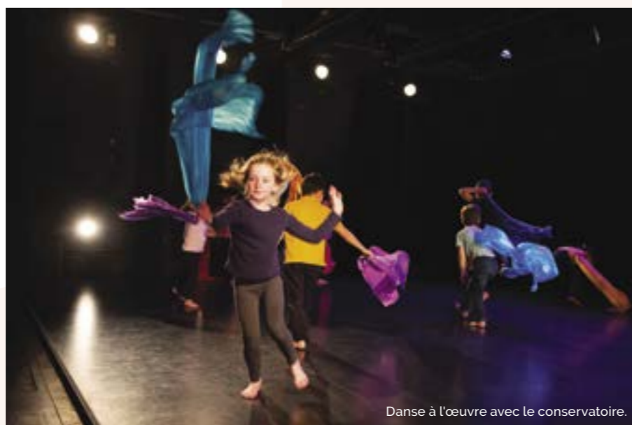
Danse à l'œuvre avec le conservatoire.

Les jeunes Bagnoletais disposent d'un large éventail de dispositifs pour s'initier à la musique et aux arts de la scène, notamment grâce à la présence du Conservatoire de danse et de musique Erik-Satie de Bagnolet, une structure gérée par Est Ensemble. La Ville dispose ainsi d'une forte présence de l'Éducation artistique et culturelle (EAC). Le conservatoire accueille chaque année environ 500 élèves ainsi que près de 200 scolaires (du CE1 au CM2). La pierre angulaire de l'accès des jeunes bagnoletais à l'éducation artistique et musicale demeure les Classes à horaires aménagés musique (CHAM), grâce à un partenariat entre le collège Georges-Politzer et le Conservatoire Erik-Satie. Le principe est simple: au sein des classes CHAM, les élèves du collège Georges-Politzer bénéficient d'un enseignement musical hebdomadaire gratuit assuré par des professeurs du Conservatoire à raison de deux matinées par semaine sur le temps scolaire.