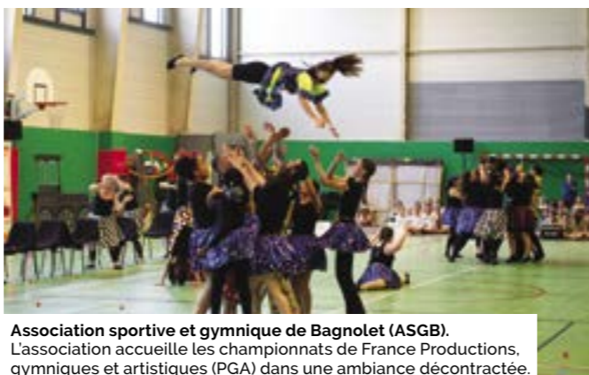
Association sportive et gymnique de Bagnolet (ASGB). L'association accueille les championnats de France Productions, gymniques et artistiques (PGA) dans une ambiance décontractée.