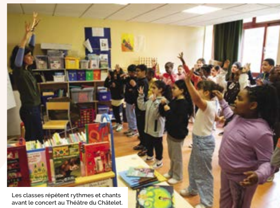
Les classes répètent rythmes et chants avant le concert au Théâtre du Châtelet.

« Je suis toujours partante pour travailler avec les gamins. Cela permet de mettre en perspective votre carrière et ce que vous avez fait jusque-là. C'est un public attentif, qui sait poser les bonnes questions ! », explique Angélique Kidjo.