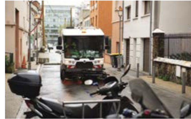
Nettoyage mécanique de la rue Victor-Hugo.