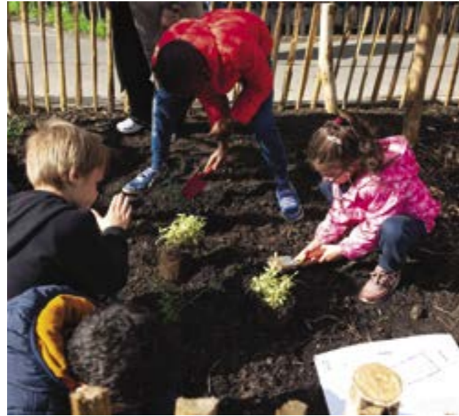
Plantations par les enfants de l'accueil de loisirs Henri-Wallon aux pieds des nouveaux arbres, rue Robespierre.