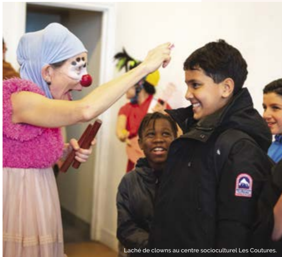
Lâché de clowns au centre socioculturel Les Coutures.

Le Samovar, le théâtre-école pour les clowns burlesques et excentriques, travaille depuis plusieurs années en partenariat avec les centres socioculturels La Fosse-aux-Fraises et Pablo-Neruda. L'association mène ainsi tout au long de l'année des stages «Clown pour toustes» à destination du jeune public ainsi que des ateliers mixtes parents-enfants. Ces stages d'une semaine se déroulent trois fois par an pendant les vacances de février, les vacances d'avril et celles de La Toussaint. Cette année, Le Samovar a également mené des actions en lien avec le thème de la parentalité avec les centres socioculturels Pablo-Neruda et La Fosse-aux-Fraises, en partenariat avec le Programme de réussite éducative (PRE) de la Ville et l'Association des familles de Bagnolet. Ces stages ont été conçus pour un public familial et invitent à un parcours artistique pour rentrer étape par étape dans le personnage puis vers le jeu. Au cours de leur cursus, les élèves du Samovar interviennent également dans des établissements scolaires (de la maternelle au lycée), mais aussi dans des centres de quartier ou lors de manifestations municipales. En mai dernier, des «lâchers de clowns» ont eu lieu au collège Georges-Politzer et au lycée Eugène-Hénaff. Cette prestation artistique insolite est entièrement improvisée. Les lâchers de clowns font partie intégrante du programme pédagogique des élèves de la formation professionnelle. Le Samovar mène également des ateliers pédagogiques et artistiques centrés autour