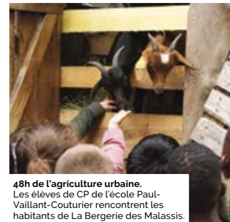
48h de l'agriculture urbaine. Les élèves de CP de l'école Paul-Vaillant-Couturier rencontrent les habitants de La Bergerie des Malassis.