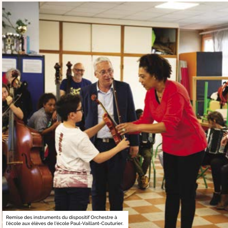
Remise des instruments du dispositif Orchestre à l'école aux élèves de l'école Paul-Vaillant-Couturier.

Le projet DÉMOS, porté par la Philharmonie de Paris, propose un apprentissage de la musique classique à des enfants ne disposant pas d'un accès facile à cette pratique pour des raisons économiques, sociales ou géographiques. À Bagnolet, il s'adresse à des enfants de 7 à 12 ans habitant dans des Quartiers prioritaires de la politique de la ville [QPV]. Chaque enfant se voit confier un instrument de musique pendant 3 ans et participe à des ateliers hebdomadaires dans une structure sociale ou socioculturelle de proximité. Encadrés par deux intervenants artistiques (musiciens, chefs de chœur, danseurs) et un professionnel du champ social, ces ateliers se font en groupe d'une quinzaine d'enfants qui apprennent la musique par familles d'instruments. Une fois par mois, les enfants répètent en orchestre complet [tutti] sous la direction d'un chef ou d'une cheffe d'orchestre et participent à des stages pendant les vacances scolaires. Chaque année, un grand concert est organisé dans un lieu emblématique du territoire où est implanté l'orchestre. À l'issue des 3 ans, les enfants peuvent bénéficier d'un accompagnement vers le conservatoire ou l'école de musique de leurs territoires. Les apprentis musiciens conservent alors leurs instruments de musique et intègrent parfois un Orchestre DÉMOS d'un niveau plus avancé.