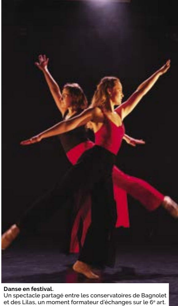
Danse en festival. Un spectacle partagé entre les conservatoires de Bagnolet et des Lilas, un moment formateur d'échanges sur le 6 e art.