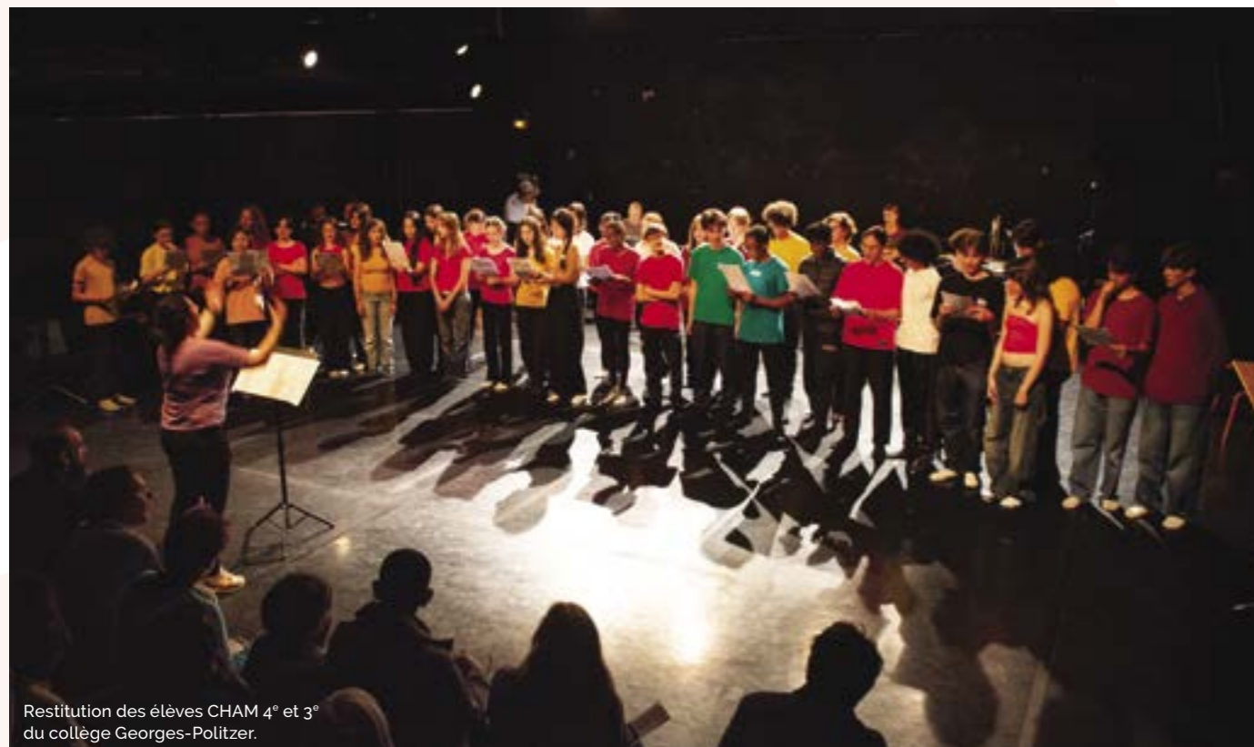
Restitution des élèves CHAM 4 e et 3 e du collège Georges-Politzer.