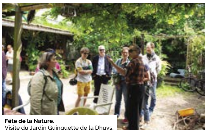
Fête de la Nature. Visite du Jardin Guinguette de la Dhuy.