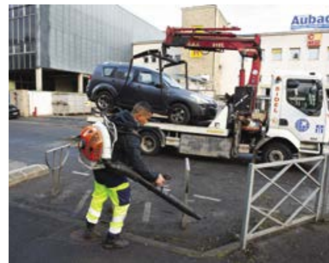
Nettoyage de la rue Jean-Lolive conjointement avec la Ville de Montreuil.