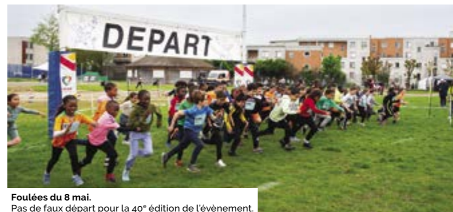
Foulées du 8 mai. Pas de faux départ pour la 40 e édition de l'évènement.