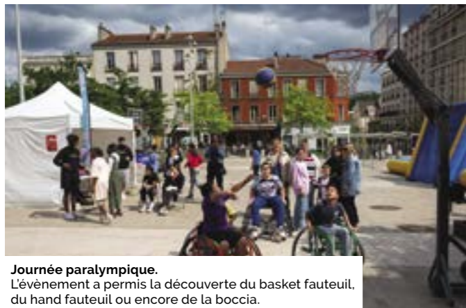
Journée paralympique. L'évènement a permis la découverte du basket fauteuil, du hand fauteuil ou encore de la boccia.

Le coup d'envoi des Jeux olympiques et paralympiques de Paris 2024 sera lancé le 26 juillet prochain. Les chiffres annoncés donnent le tournis. Près de 15 000 athlètes venus des quatre coins du monde sont attendus pour les Jeux. Ils seront logés au Village olympique qui est réparti sur 3 communes : Saint-Denis, Saint-Ouen-Sur-Seine et l'Île-Saint-Denis, et qui accueillera 14 500 athlètes et leur staff pendant les Jeux olympiques, et 9 000 athlètes et leur staff pendant les Jeux paralympiques. Jusqu'à 60 000 repas seront servis par jour, et une polyclinique sera à disposition des athlètes 7 jours sur 7 et 24h sur 24. Pendant les Jeux paralympiques, un centre « Orthotic, prosthetic and wheelchair repair center » sera à leur disposition pour faire réparer prothèses et fauteuils, sans coût. L'organisation prévoit 15 millions de spectateurs, dont deux millions de spectateurs étrangers. 30 000 bénévoles ont été recrutés pour accueillir, renseigner, installer les spectateurs, mais aussi les sportifs ou encore pour aider aux quelques 6 000 contrôles antidopage réalisés pendant les Jeux. À Bagnolet, le jeudi 25 juillet, dans la matinée, à la veille de la cérémonie d'ouverture des Jeux, le relais de la flamme olympique traversera les rues de la ville pour une journée festive.