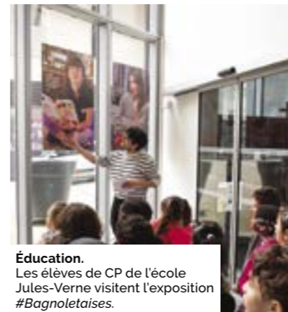
Éducation. Les élèves de CP de l'école Jules-Verne visitent l'exposition #Bagnoletaises.