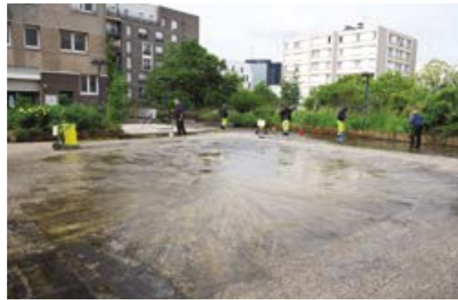
Nettoyage de la dalle Maurice-Thorez.