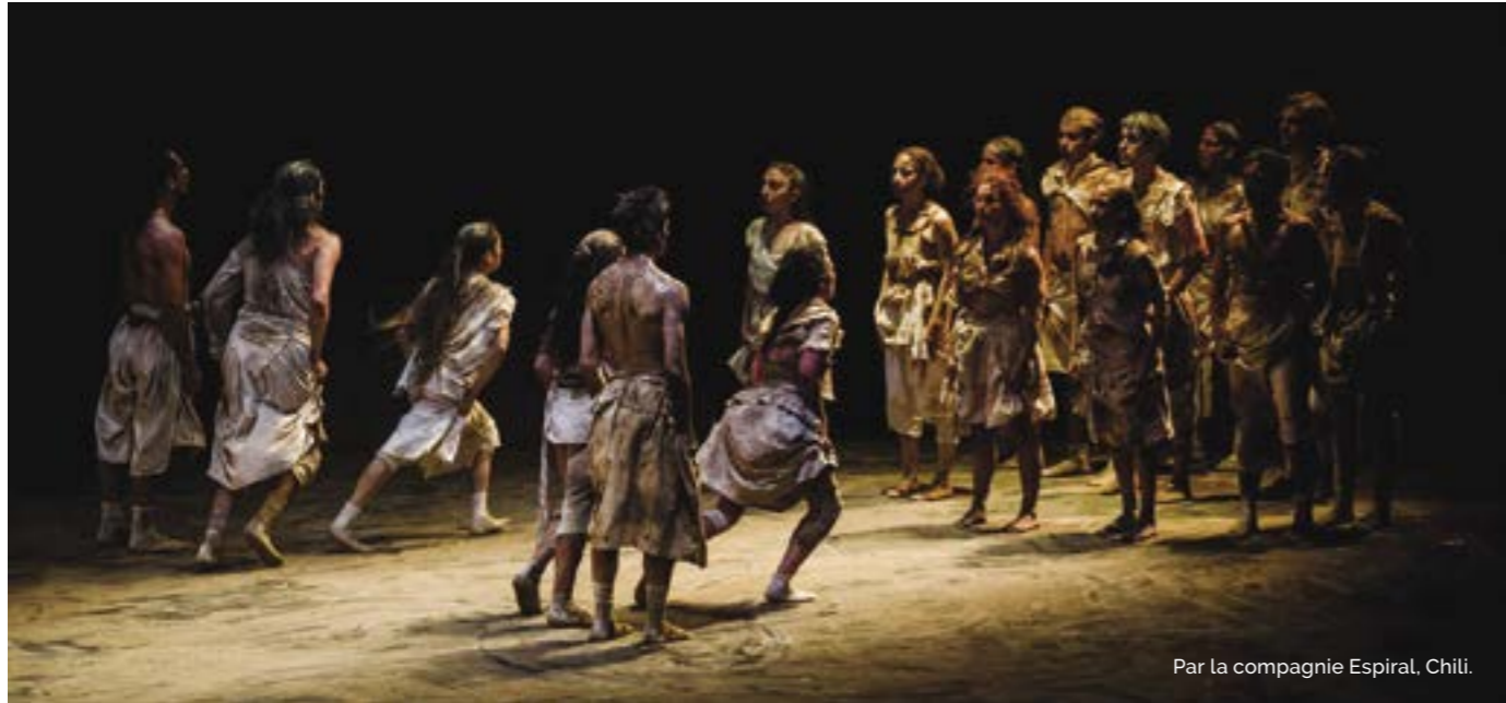
Par la compagnie Espiral, Chili.