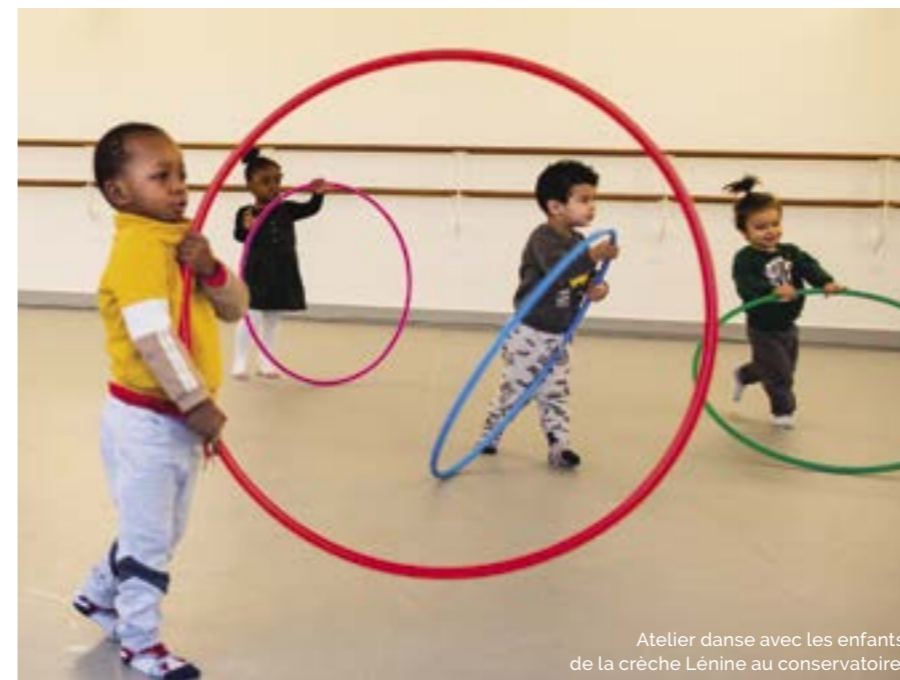
Atelier danse avec les enfants de la crèche Lénine au conservatoire.

À Bagnolet, le dispositif CHAM du collège concerne quatre classes réparties sur quatre niveaux de la 6 e jusqu'à la 3 e . Il permet de proposer cet enseignement musical aux collégiens concernés tout au long de leur cursus scolaire. En complé-