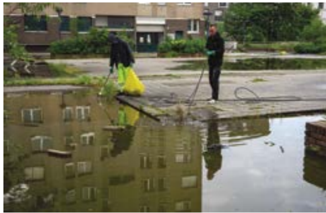
Curetage et nettoyage de la dalle Maurice-Thorez.