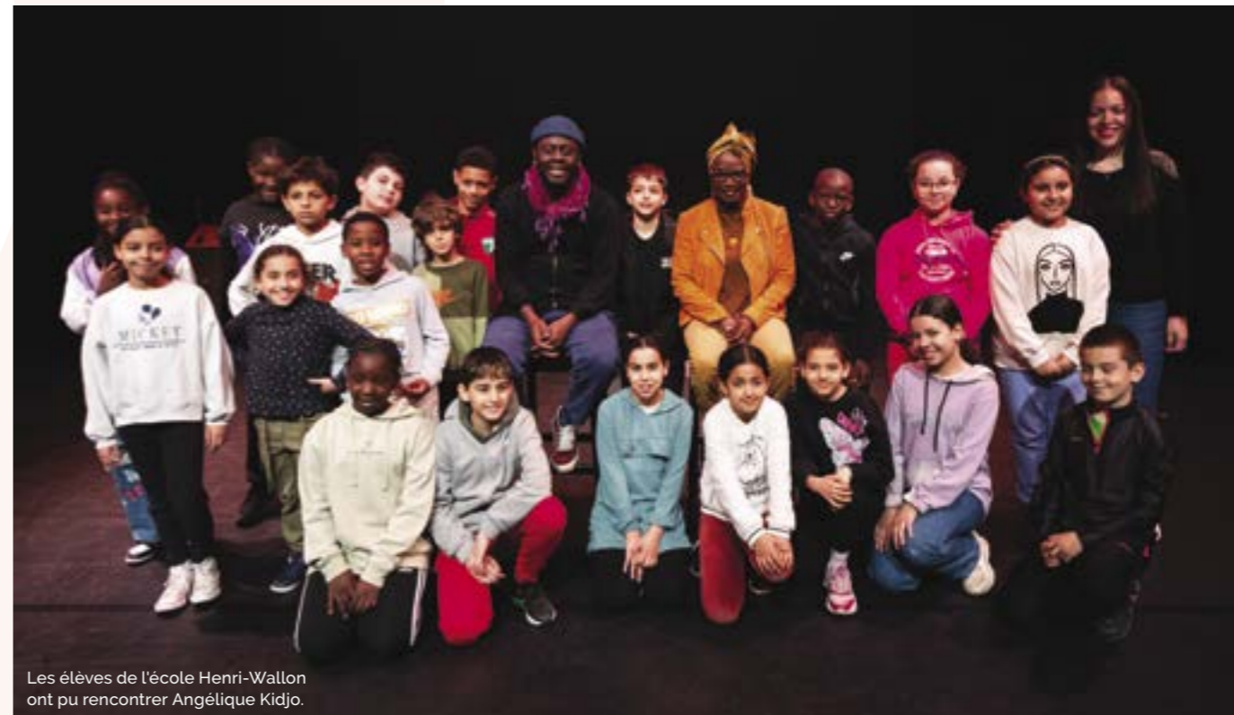
Les élèves de l'école Henri-Wallon ont pu rencontrer Angélique Kidjo.